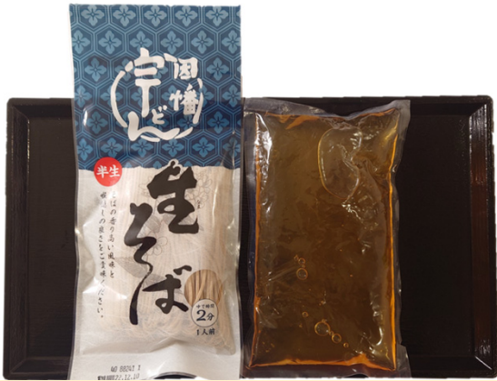
かけそばセット（半生そば・だし） 445円（税込480円）